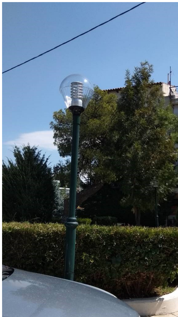
ΦΩΤΟΓΡΑΦΙΑ 1 (Είδη Υπομήματος Γ3, Άρθρο 1 & 2) ΦΩΤΙΣΤΙΚΟ ΤΥΠΟΥ «ΟΥΡΑ» (ΠΛΑΤΕΙΑ ΟΜΟΝΟΙΑΣ ΔΗΜΟΤΙΚΗ ΕΝΟΤΗΤΑ ΑΓ. ΣΤΕΦΑΝΟΥ)

Επισυνάπτονται φωτογραφίες που αναφέρονται στην Τεχνική Περιγραφή του Τμήματος Γ, Υπομήμα Γ3 και Γ4 της παρούσας Μελέτης.