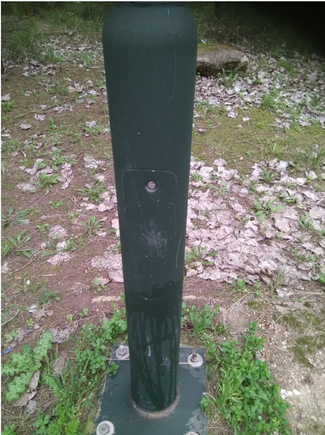
ΦΩΤΟΓΡΑΦΙΑ 16 (Είδη Υποτμήματος Γ4, Άρθρο 12/13/14) ΠΟΡΤΑ ΙΣΤΟΥ (ΠΕΡΙΒΑΛΛΟΝ ΧΩΡΟΣ ΓΗΠΕΔΟΥ ΔΗΜΟΤΙΚΗΣ ΕΝΟΤΗΤΑ ΔΡΟΣΙΑΣ)