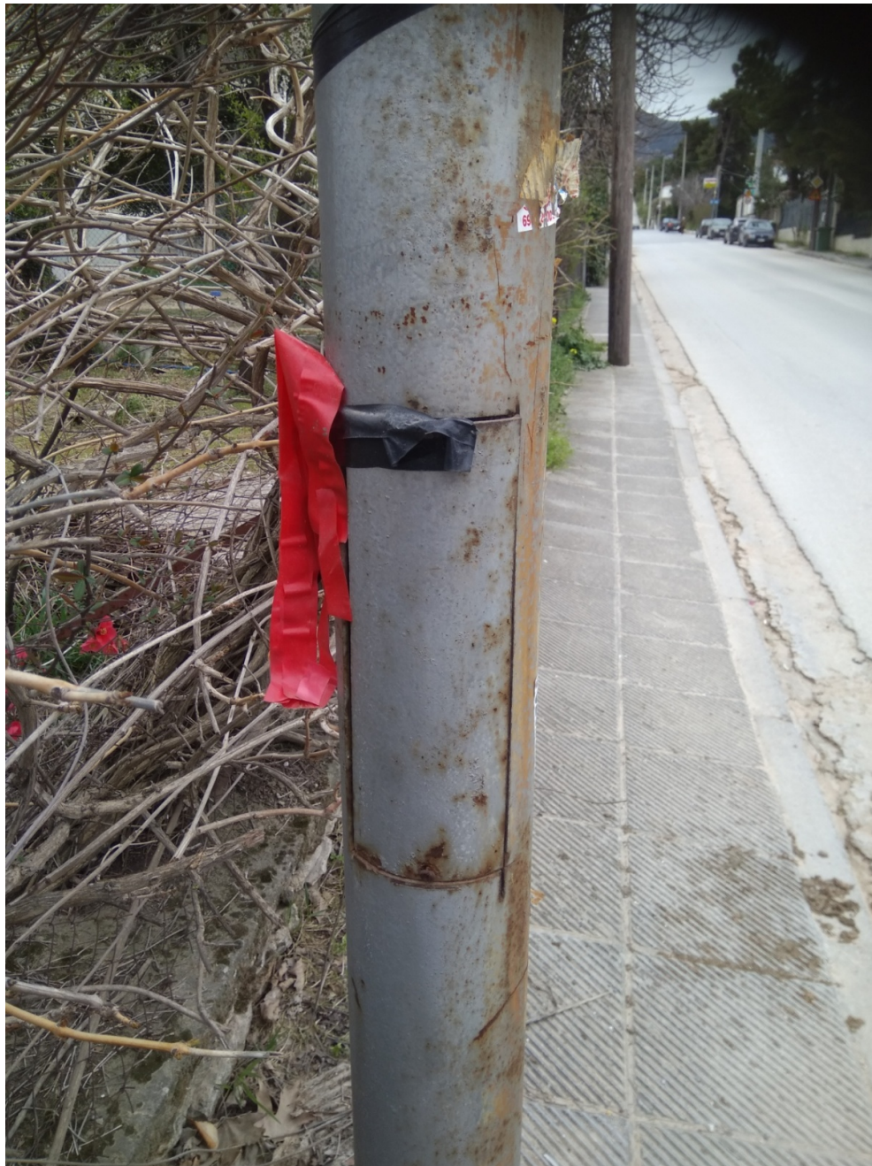
ΦΩΤΟΓΡΑΦΙΑ 15 (Είδη Υποτμήματος Γ4, Άρθρο 12/13/14) ΠΟΡΤΑ ΙΣΤΟΥ (ΛΕΩΦΟΡΟΣ ΡΟΔΟΠΟΛΕΩΣ ΔΗΜΟΤΙΚΗ ΕΝΟΤΗΤΑ ΔΡΟΣΙΑΣ)