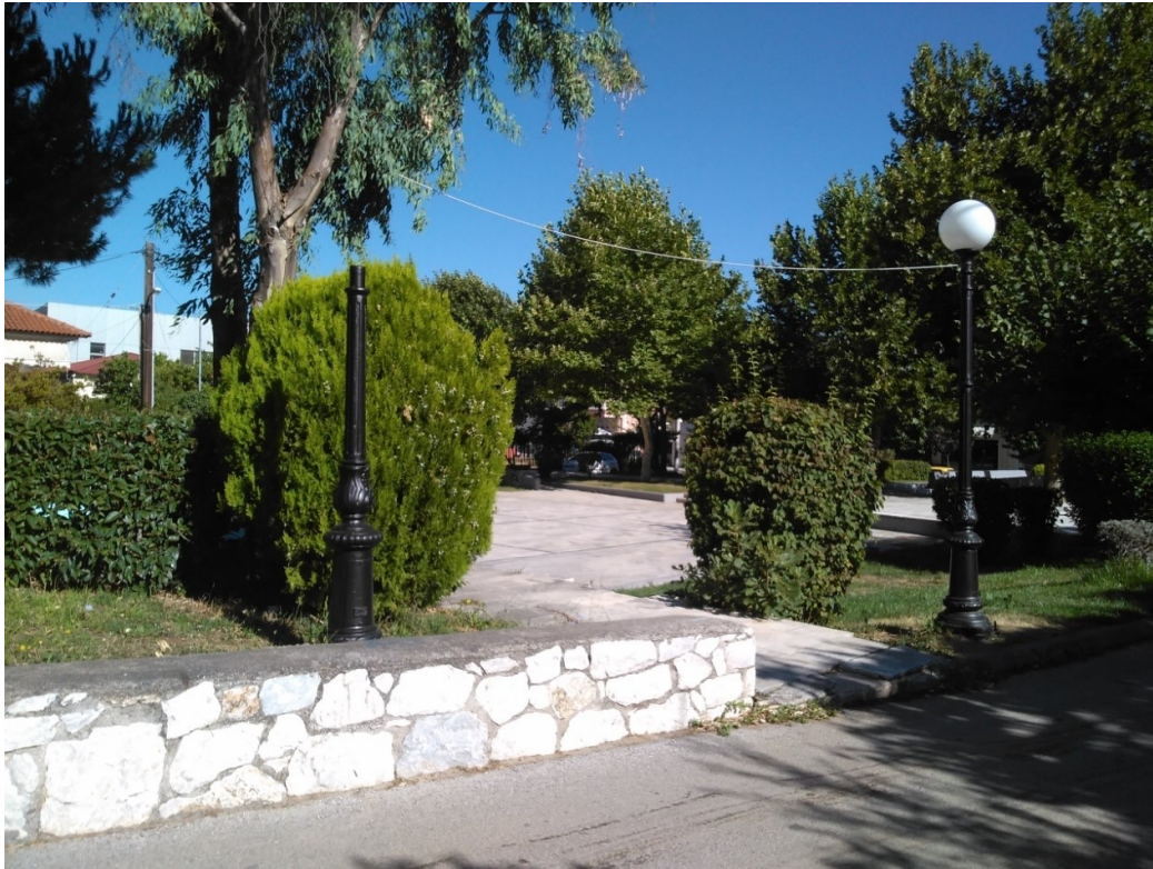
ΦΩΤΟΓΡΑΦΙΑ 8 (Είδη Υπομήματος Γ3, Άρθρο 8) ΦΩΤΙΣΤΙΚΟ ΣΩΜΑ ΚΕΦΑΛΗΣ ΤΥΠΟΥ ΜΠΑΛΑΣ (ΠΛΑΤΕΙΑ ΔΗΜΟΤΙΚΗΣ ΕΝΟΤΗΤΑΣ ΡΟΔΟΠΟΛΗΣ)