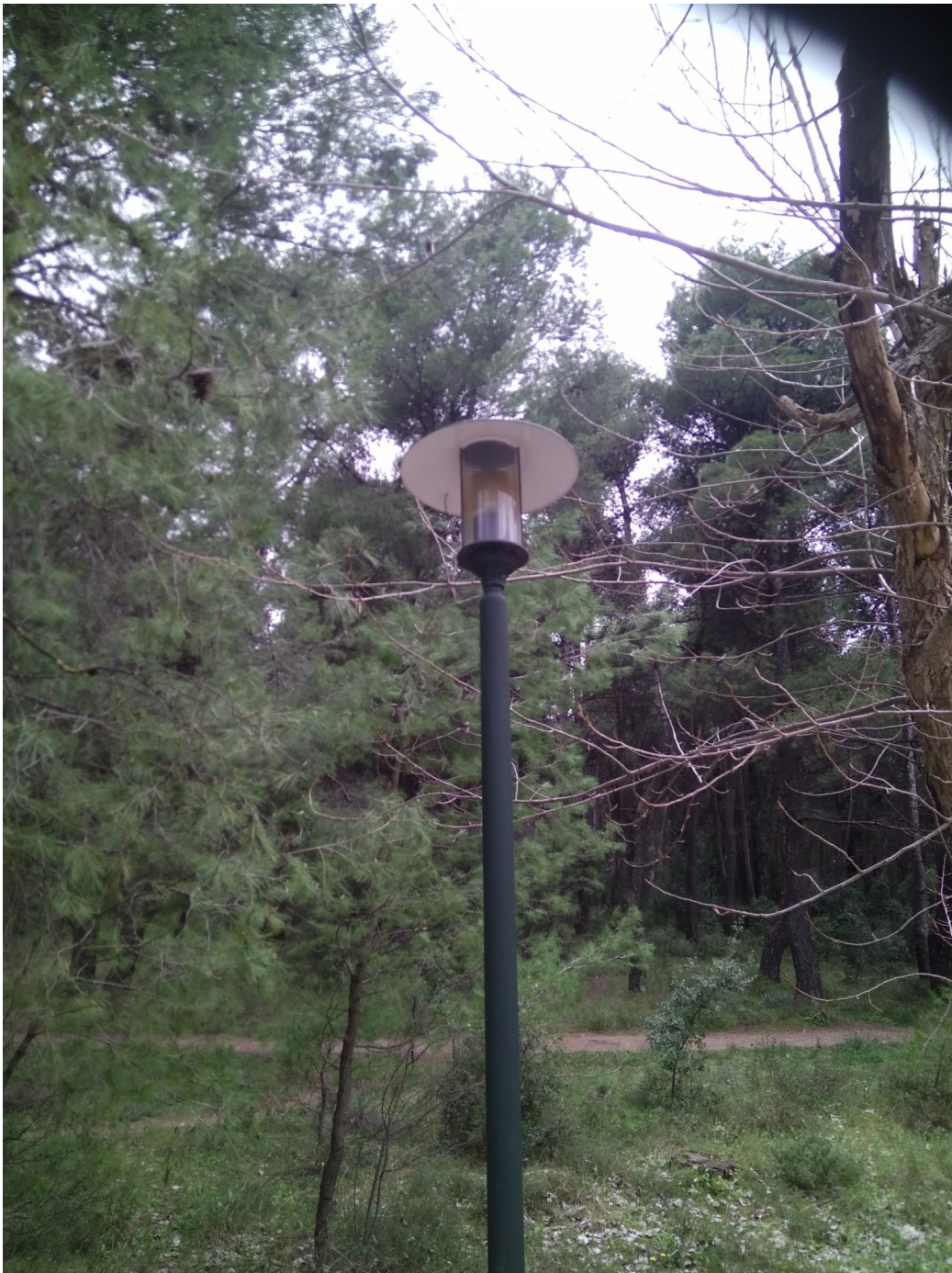
ΦΩΤΟΓΡΑΦΙΑ 13 (Είδη Υπομήματος Γ3, Άρθρο 13) ΦΩΤΙΣΤΙΚΟΥ ΣΩΜΑΤΟΣ ΚΕΦΑΛΗΣ ΑΛΟΥΜΙΝΙΟΥ ΜΕ ΑΤΣΑΛΙΝΟ ΚΑΠΕΛΟ ΓΙΑ ΛΑΜΠΤΗΡΑ ΤΥΠΟΥ E27 LED ΠΕΡΙΒΑΛΛΟΝ ΧΩΡΟΣ ΓΗΠΕΔΟΥ ΔΗΜΟΤΙΚΗΣ ΕΝΟΤΗΤΑΣ ΔΡΟΣΙΑΣ