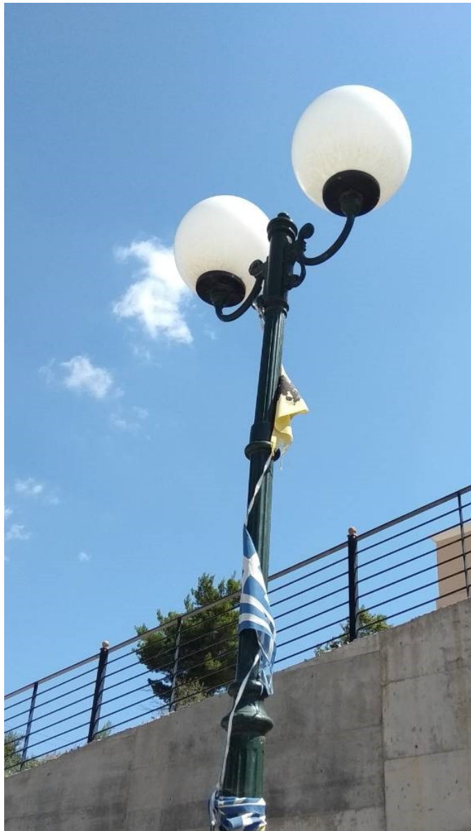
ΦΩΤΟΓΡΑΦΙΑ 15 (Είδη Υπομήματος Γ3, Άρθρο 9) ΚΕΦΑΛΗ ΜΕ ΒΑΣΗ ΣΤΗΡΙΞΗΣ, ΔΥΟ ΒΡΑΧΙΟΝΕΣ ΚΑΙ ΔΥΟ (2) ΦΩΤΙΣΤΙΚΑ ΣΩΜΑΤΑ Φ300 ΜΕ ΛΑΜΠΤΗΡΕΣ LED (ΟΔΟΣ ΜΕΓΑΛΟΥ ΑΛΕΞΑΝΔΡΟΥ ΔΗΜΟΤΙΚΗ ΕΝΟΤΗΤΑ ΣΤΑΜΑΤΑΣ)