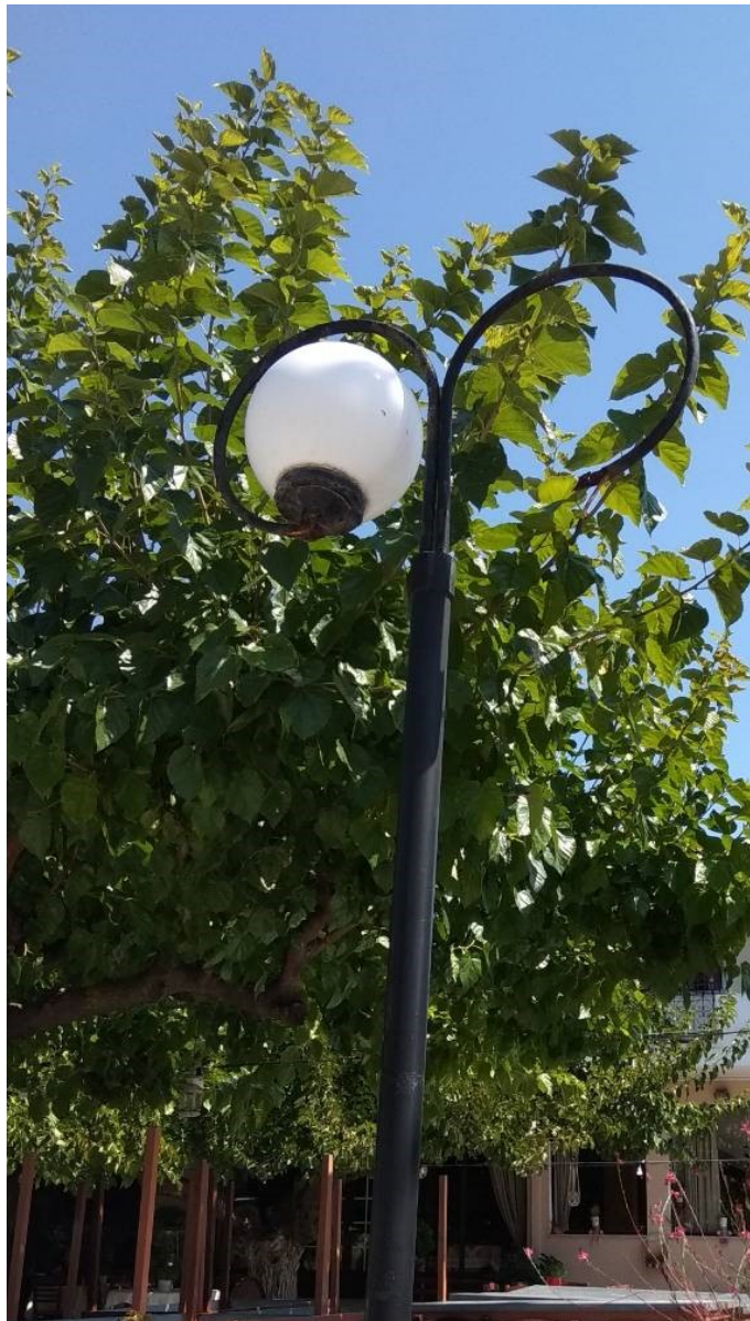
ΦΩΤΟΓΡΑΦΙΑ 9 (Είδη Υπομήματος Γ3, Άρθρο 9) ΚΕΦΑΛΗ ΜΕ ΒΑΣΗ ΣΤΗΡΙΞΗΣ, ΔΥΟ ΒΡΑΧΙΟΝΕΣ ΚΑΙ ΔΥΟ ΦΩΤΙΣΤΙΚΑ ΜΠΑΛΑΣ Φ300 ΜΜ ΜΕ ΛΑΜΠΤΗΡΕΣ LED (ΟΔΟΣ ΑΛΩΝΙΩΝ ΔΗΜΟΤΙΚΗ ΕΝΟΤΗΤΑ ΣΤΑΜΑΤΑΣ)