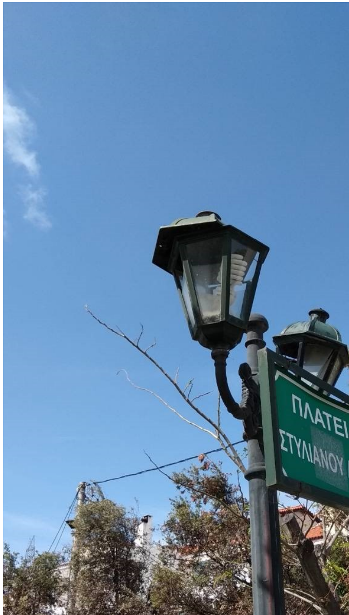
ΦΩΤΟΓΡΑΦΙΑ 5 (Είδη Υποτμήματος Γ3, Άρθρο 5) ΚΕΦΑΛΗ ΜΕ ΒΑΣΗ ΣΤΗΡΙΞΗΣ, ΔΥΟ ΒΡΑΧΙΟΝΕΣ ΚΑΙ ΔΥΟ ΦΩΤΙΣΤΙΚΑ ΤΥΠΟΥ «ΠΑΡΑΔΟΣΙΑΚΟ ΦΑΝΑΡΙ», ΜΕΣΑΙΟ, ΜΕ ΛΑΜΠΤΗΡΕΣ LED (ΠΛΑΤΕΙΑ ΛΙΑΠΗ ΔΗΜΟΤΙΚΗ ΕΝΟΤΗΤΑ ΚΡΥΟΝΕΡΙΟΥ)