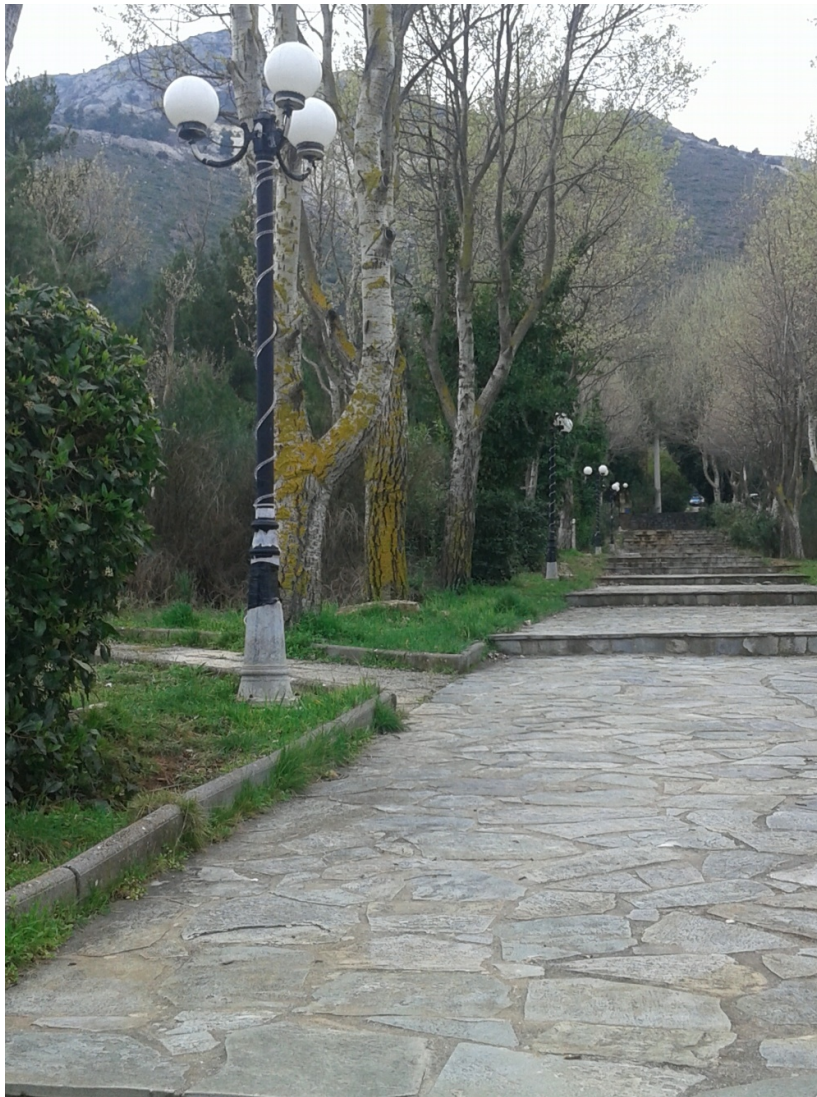
ΦΩΤΟΓΡΑΦΙΑ 10 (Είδη Υποτμήματος Γ3, Άρθρο 10) ΚΕΦΑΛΗ ΜΕ ΒΑΣΗ ΣΤΗΡΙΞΗΣ, ΤΡΕΙΣ ΒΡΑΧΙΟΝΕΣ ΚΑΙ ΤΡΙΑ ΦΩΤΙΣΤΙΚΑ ΜΠΑΛΑΣ Φ300 ΜΜ ΜΕ ΛΑΜΠΤΗΡΕΣ LED (ΠΛΑΤΕΙΑ ΚΙΟΥ ΔΗΜΟΤΙΚΗ ΕΝΟΤΗΤΑ ΔΙΟΝΥΣΟΥ)