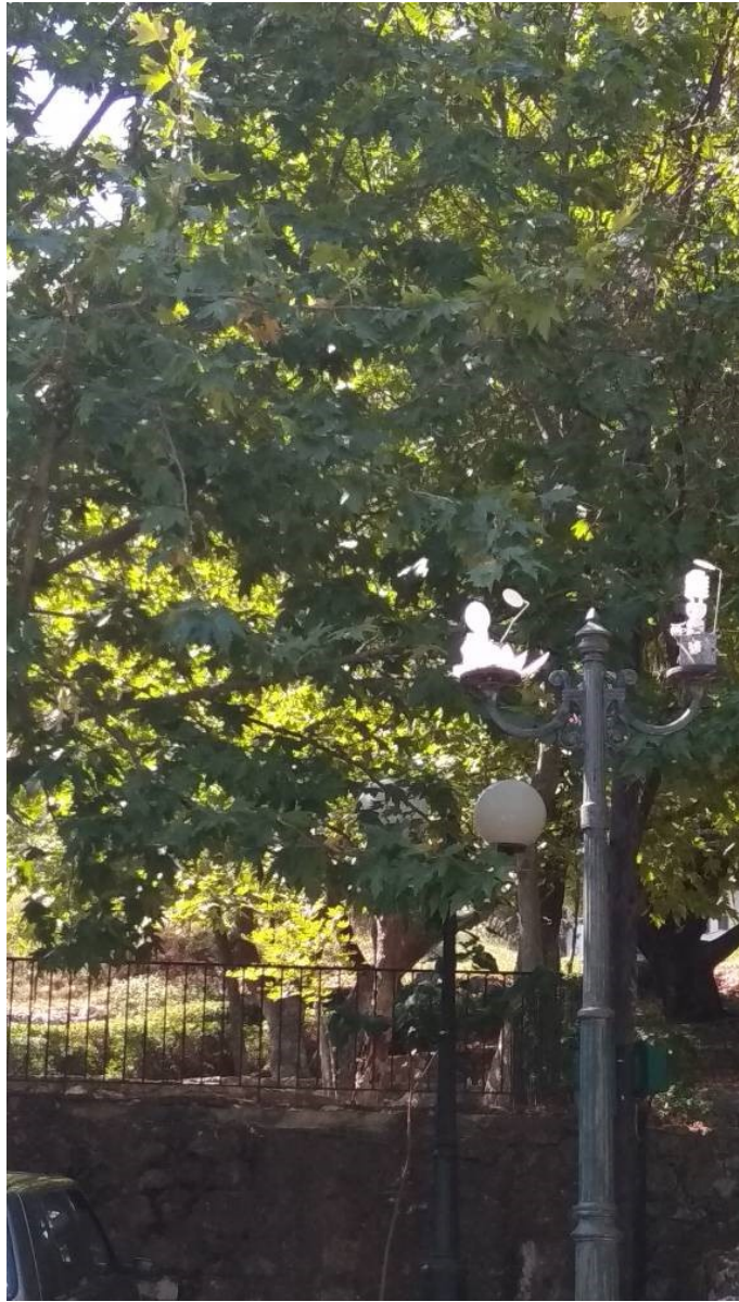
ΦΩΤΟΓΡΑΦΙΑ 14 (Είδη Υπομήματος Γ3, Άρθρο 9) ΚΕΦΑΛΗ ΜΕ ΒΑΣΗ ΣΤΗΡΙΞΗΣ, ΔΥΟ ΒΡΑΧΙΟΝΕΣ ΚΑΙ ΔΥΟ (2) ΦΩΤΙΣΤΙΚΑ ΣΩΜΑΤΑ Φ300 ΜΕ ΛΑΜΠΤΗΡΕΣ LED (ΟΔΟΣ ΜΕΓΑΛΟΥ ΑΛΕΞΑΝΔΡΟΥ ΔΗΜΟΤΙΚΗ ΕΝΟΤΗΤΑ ΣΤΑΜΑΤΑΣ)