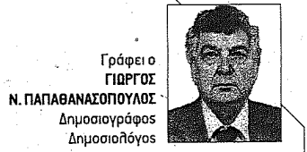
Γράφει ο ΓΙΩΡΓΟΣ Ν. ΠΑΠΑΘΑΝΑΣΟΠΟΥΛΟΣ Δημοσιογράφος Δημοσιολόγος

σει, ακριβώς γιατί δεν πρόκειται για το πραγματικό απόλυτο... Η γνώση είναι η στέρεη τροφή το ηδονιστή, είναι η δικαιολογία του μετά την ηδονή. Ένα άτομο που δεν πιστεύει στο θεό, μίση στον άνθρωπο μπορεί να βρει άλλη πιθανότητα απόλυτου και ελευθερίας παρά στον έξω κόσμο, στη φύση... Αλλά η ελευθερία που το άτομο αντλεί από τη φύση είναι αυταπάτη ελευθερίας, γιατί η φύση δεν είναι το απόλυτο. Η αιωνιότητα, ως το μοναδικό απόλυτο στον άνθρωπο, δεν έχει όρια. Αντίθετα όλα όσα τον περιβάλλουν στον πλανήτη μας είναι σχετικά και έχουν όρια. Η υπέρβαση των ορίων αυτών οδηγεί στην ύβρη. Κατά το Μέγα Λεξικό της Ελληνικής Γλώσσας των Liddell - Scott «ύβρις είναι αυθάδης βία, ηγγάζουσα εξ υπερβολικής συναίσθησως δυνάμεως, ή εκ του πάθους