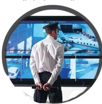
Στατική φύλαξη Χώρων