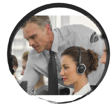
Κέντρο Λήψης Σημάτων